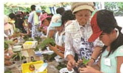
こけ玉づくり体験 Moss ball making workshop