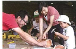
ウッドィーフェスタ Woody festival

■木工教室 ■あまごつかみ ■そば打ち ■茶摘み体験 ■こけ玉づくり体験、等 自然を体験・学習できる様々なイベントを行っています。詳しくは本パンフレット裏面(津市美杉総合支所)までお問い合わせ下さい。