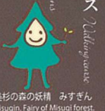
美杉の妖精 みずぎん Misugin, Fairy of Misugi forest.

【雪姫亭・美杉ふるさと資料館に関するお問い合わせ先】 Information about Yukihimetei & Misugi Furusato Material pavilion ■ 美し郷霧山施設管理運営協議会 〒515-3312 三重県津市美杉町上多気 1010 TEL 059-275-0240 定休日：月曜日 ■ Umashisato Kiriyama Facilities management conference Kamitage1010 Misugi Town Tsu City Mie Prefecture. Closed Monday 【森林セラピーに関するお問い合わせ先】 Information about Forest therapy ■ 津市美杉総合支所 〒515-3421 三重県津市美杉町八知 5580-2 ■ Tsu City Misugi synthesis branch office Yachi5580-2 Misugi Town Tsu City Mie Prefecture TEL 059-272-8082 FAX 059-272-1119 E-mail 272-8082@city.tsu.lg.jp