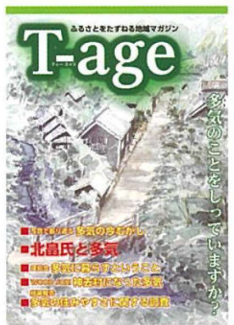
「T-age」多気の郷元気づくり協議会発行 500円 地元住民制作の地域を紹介する冊子。道の駅美杉などでお求めいただけます。

コースが通っている多気地区は、かつて伊勢国司北畠氏が本拠を構え、城下町として栄えて「小京都」と呼ばれたと伝えられています。たくさんの方の遺跡や文化財を巡って、歴史の香りを感じてみましょう。