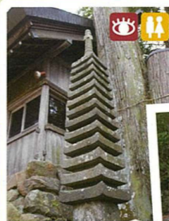
国津神社十三重塔 the thirteen-storied pagoda of Kunitu Shrine