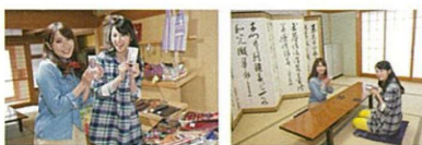
地元の特産品なども販売 宿泊も可能な広い客室