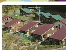
城山クラインガルテン Shiroyama kleingarten

津市の西南端、関西方面への玄関口、飯垣内を基点に、日神、西浦峠、中太郎生へと森林内を歩く健脚コース。飯垣内をスタートし、田んぼの中の舗装道を上る。葉に銀杏ができる珍しいオハツキイチョウがある日神不動院を越え、ここからは森の中を歩く。西浦峠からは急な坂を下り、山あいには開けた棚田の風景へ。ふもとまで下ったら、ふるさと公園、国津神社を散策する。