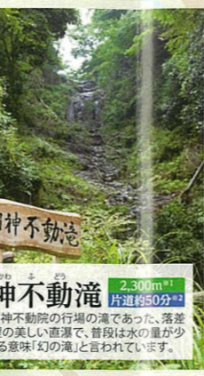
日神不動滝 Hikawa Fudo no Taki 2,300m + 片道約50分 + 昔は日神不動院の行場の滝であった、落差25m程の美しい直瀑で、昔は水の量が少なくある意味「幻の滝」と言われています。