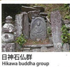
日神石仏群 Hikawa buddha group