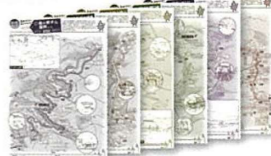
「森林セラピーガイドマップ」